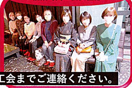
檜葉町商工会女性部