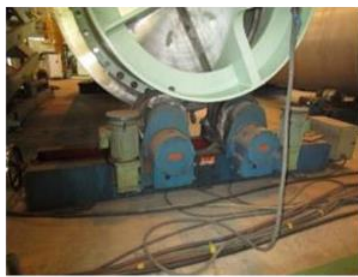
【ターニングローラー】