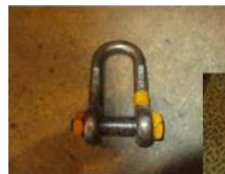
【吊り具 シャックル】